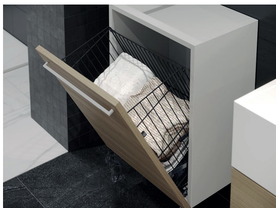
Koš na prádlo skládací antracit