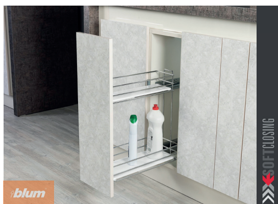
Plnovýsuvný koš s výsuvy BLUM a plným dnem chrom