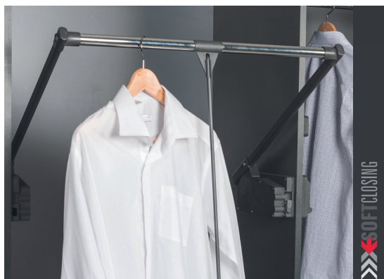
Sklopná šatní tyč (10 kg) šedá