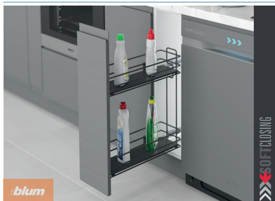
Plnovýsuvný koš s výsuvy BLUM a plným dnem antracit