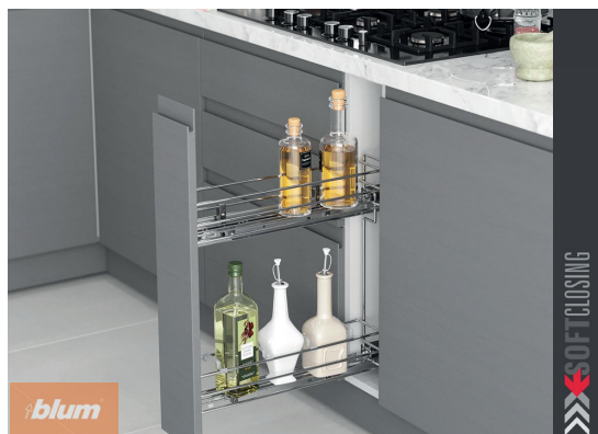
Plnovýsuvný koš s výsuvy BLUM a drátěným dnem chrom