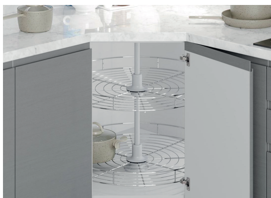
Otočný 4/4 koš (karusel) chrom