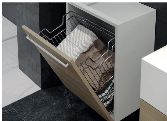
Koš na prádlo chrom