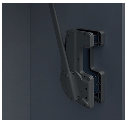
Distanční rámeček pro sklopné šatní tyče (10 kg) šedý