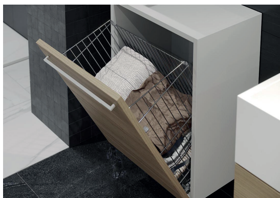
Koš na prádlo skládací chrom