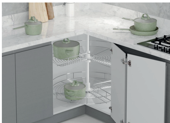
Otočný 3/4 koš (karusel) chrom