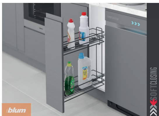
Plnovýsuvný koš s výsuvy BLUM a drátěným dnem antracit