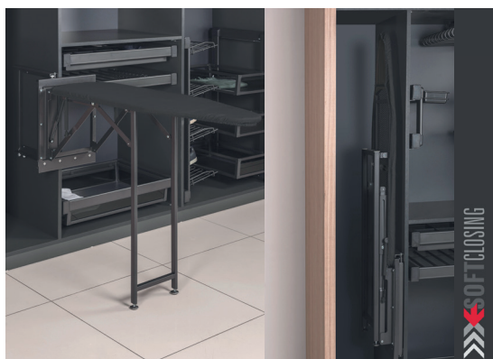
Žehlicí prkno s mechanismem uchycení do skříně šedá