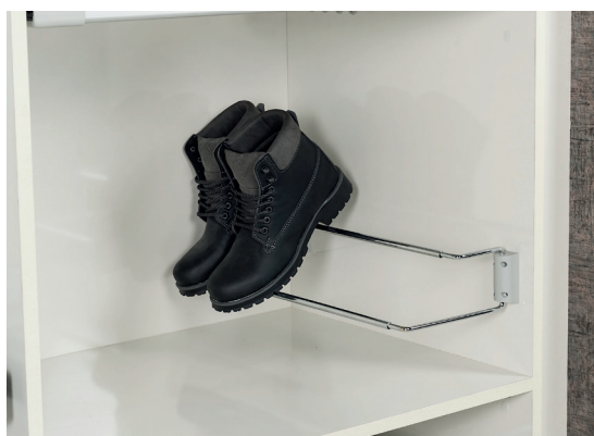
Drátěný držák na boty stavitelný chrom