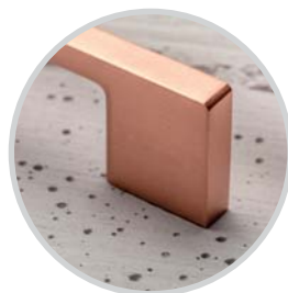
měď meď réz cupru